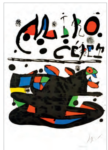
Joan Miró. Miró, Ceret, 1977. Litografia sobre paper 75 x 55 cm. Col. MAMC.