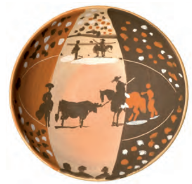
Pablo Picasso. Copel la taumàquica, 14 d'abril del 1953. Terra de Lugnon i decoració amb engalbes. H. 6,7 cm, diam. 17,5 cm. Coll. MAMC.