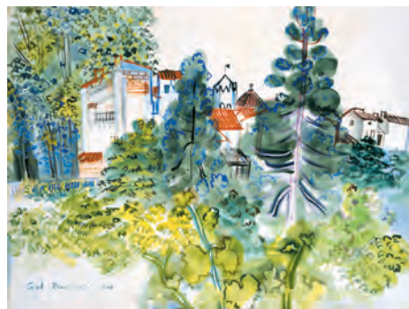
Raoul Dufy. Paisatge a Ceret, l'església, 1940. Gouache sobre paper, 42 x 56 cm. Col. MAMC.