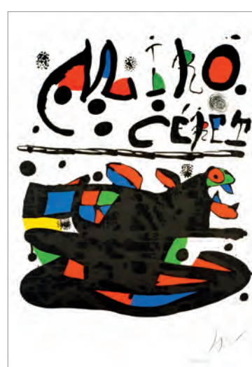
Joan Miró. Miró, Céret, 1977. Lithographie sur papier, 75 x 55 cm. Coll. MAMC.