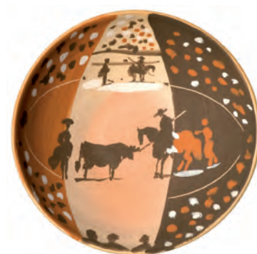
Pablo Picasso. Coupelle tauromachique, 14 avril 1953. Terre de Lagnon et décor aux engobes. H. 6,7 cm, diam. 17,5 cm. Coll. MAMC.