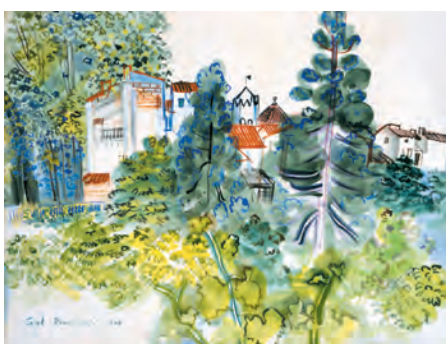
Raoul Dufy. Paysage à Céret, l'église, 1940. Gouache sur papier, 42 x 56 cm. Coll. MAMC.